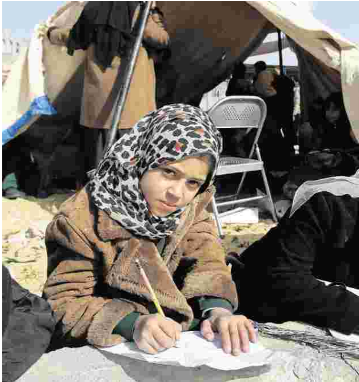
Lernen unter widrigen Bedingungen: Durch den Krieg ist die Lage besonders für Kinder extrem schwierig, weil die Schulgebäude bombardiert wurden und Lehrer umgekommen sind.

Natour: Durch den Krieg gegen Gaza ist die Lage besonders für die Kinder und Jugendlichen extrem schwierig, weil die Schulgebäude bombardiert wurden, Lehrer umgekommen sind und viele Mitschüler ihr Leben verloren haben – ganz abgesehen davon, dass die